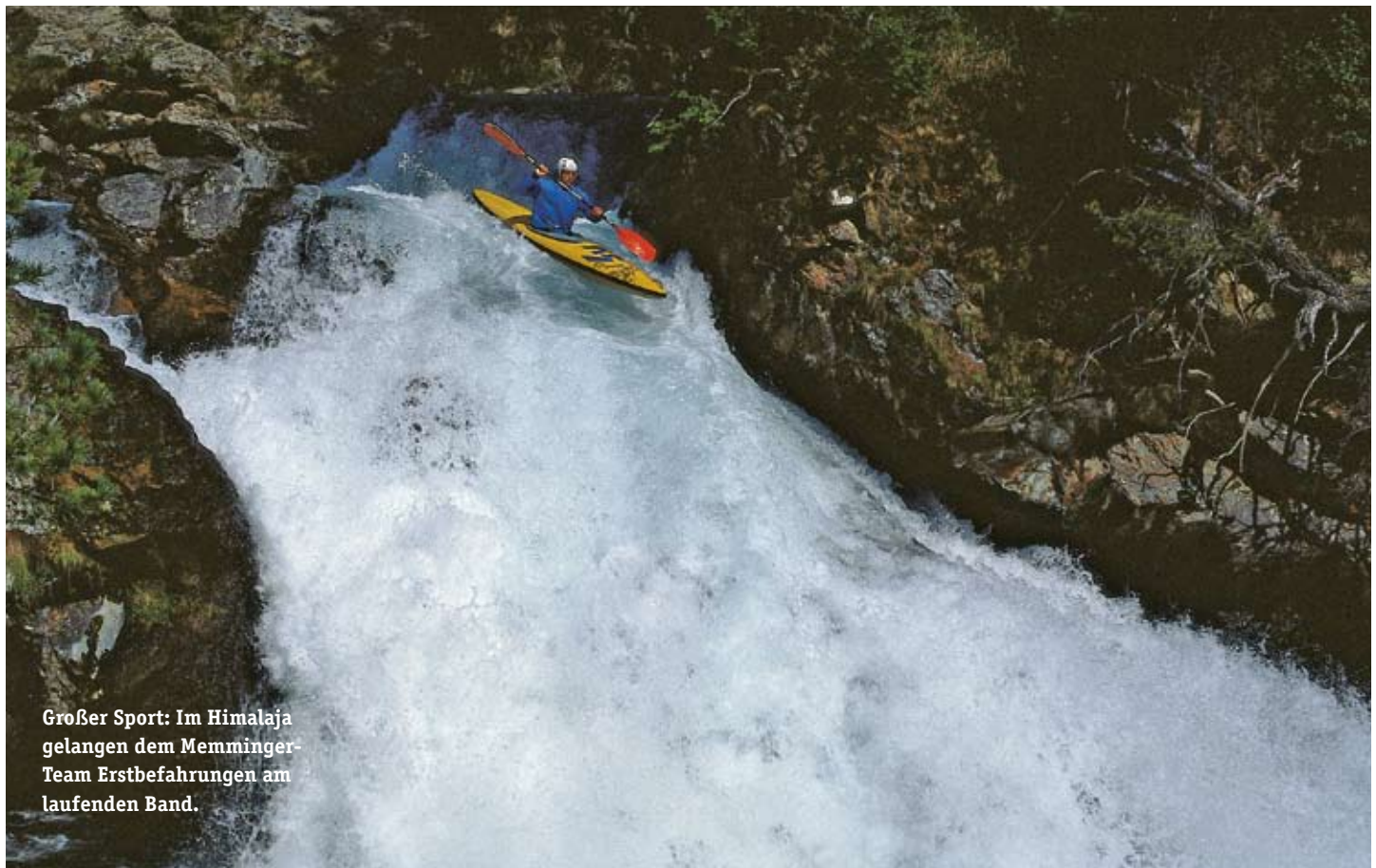
Großer Sport: Im Himalaja gelangen dem Memminger-Team Erstbefahrungen am laufenden Band.