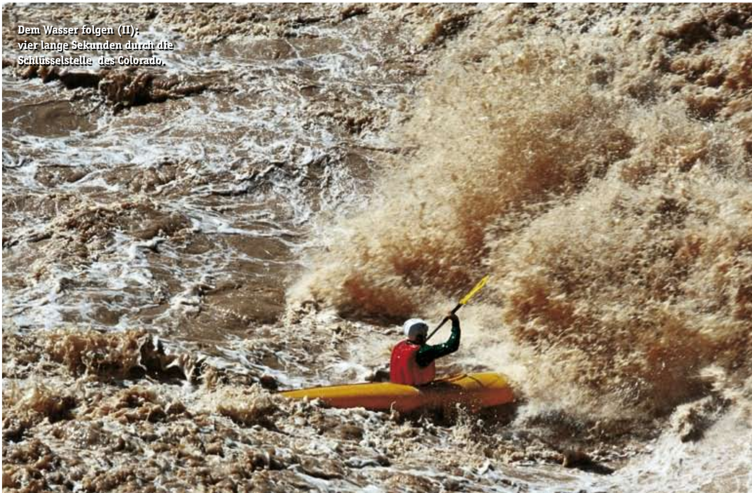
Dem Wasser folgen (II): vier lange Sekunden durch die Schlüsselstelle des Colorado.