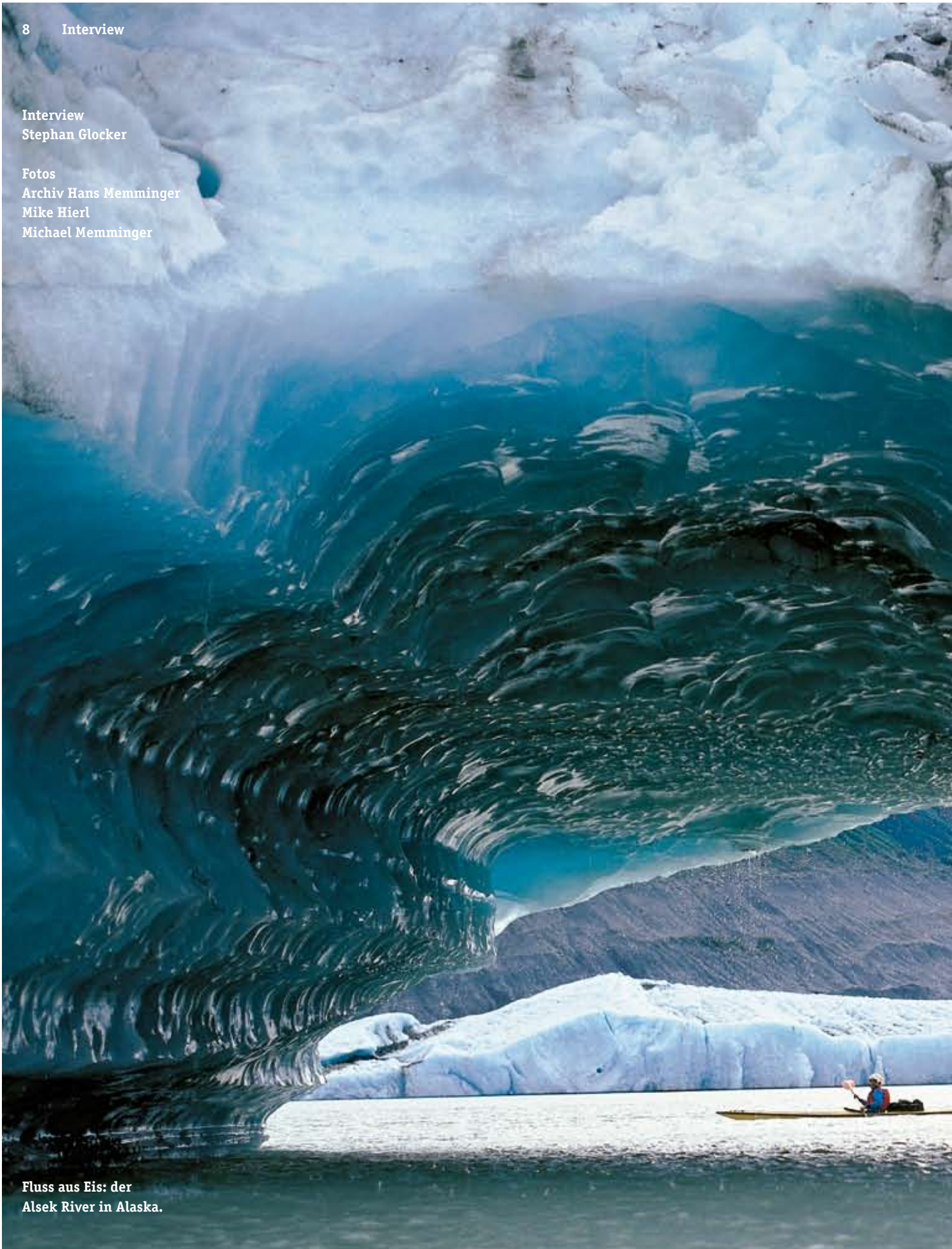
Fluss aus Eis: der Alsek River in Alaska.

Fotos Archiv Hans Memminger Mike Hierl Michael Memminger