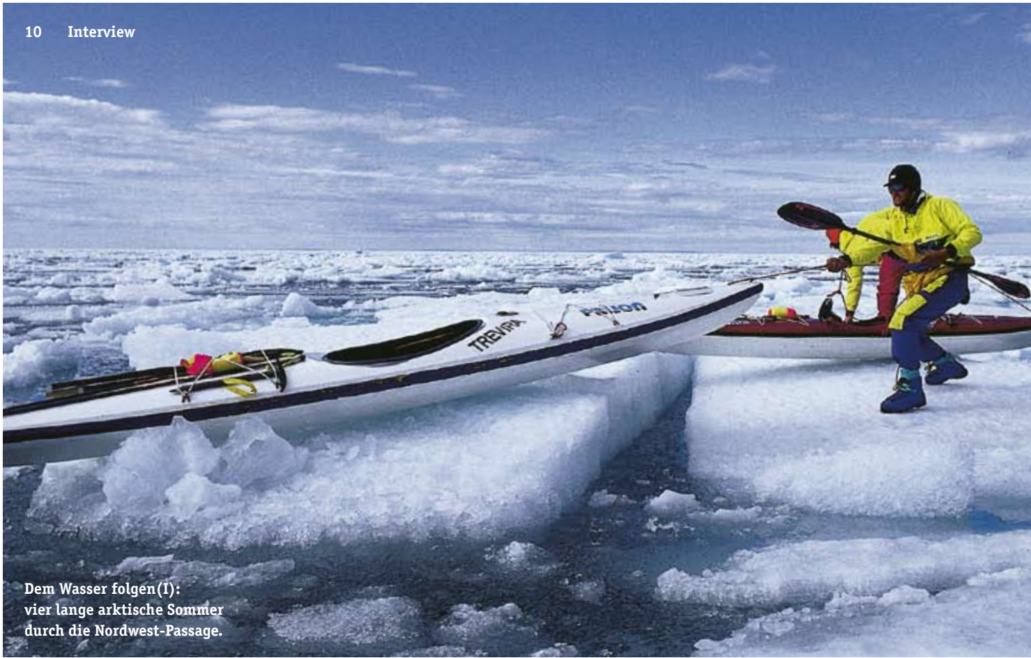
Dem Wasser folgen (I): vier lange arktische Sommer durch die Nordwest-Passage.